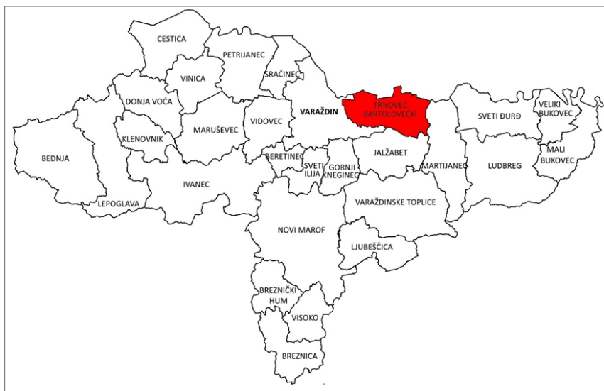
Slika 1. Položaj Općine Trnovec Bartolovečki u Varaždinskoj županiji

Općina Trnovec Bartolovečki administrativno se dijeli na 6 naselja: Bartolovec, Šemovec, Štefanec, Trnovec, Zamlaka i Žabnik.