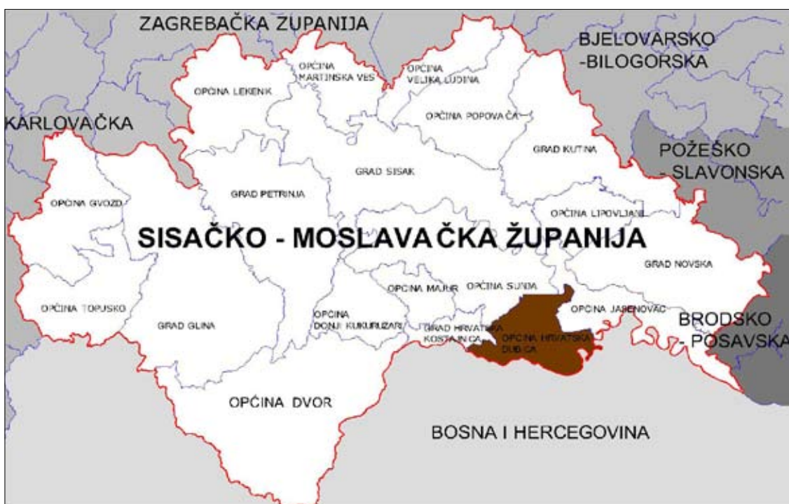
Sl. 1. Položaj Općine Hrvatske Dubice u Sisačko-moslavačkoj županiji

Područje Općine zauzima površinu od 131,65 km 2 , odnosno 2,95% teritorija Sisačko-moslavačke županije. Na području Općine nalazi se 6 naselja i to: