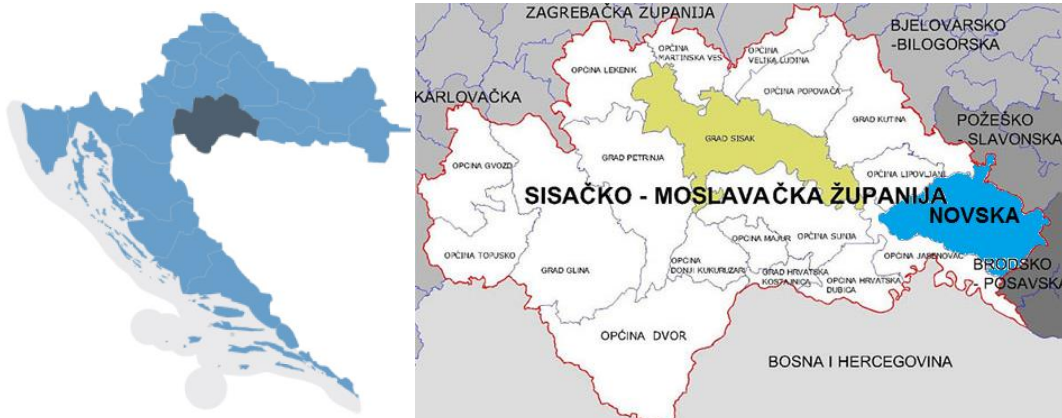
Slika 2. Položaj Sisačko-moslavačke županije unutar granica RH (lijevo) i položaj Grada Siska unutar Sisačko-moslavačke županije (desno)

općinama Sunja i Mečenčani i Gradom Petrinjom te sa zapada Općinom Lekenik. Grad Sisak zaprema površinu od 422,75 km 2 i čini 9,5% površine Sisačko-moslavačke županije, odnosno 0,75% površine države.