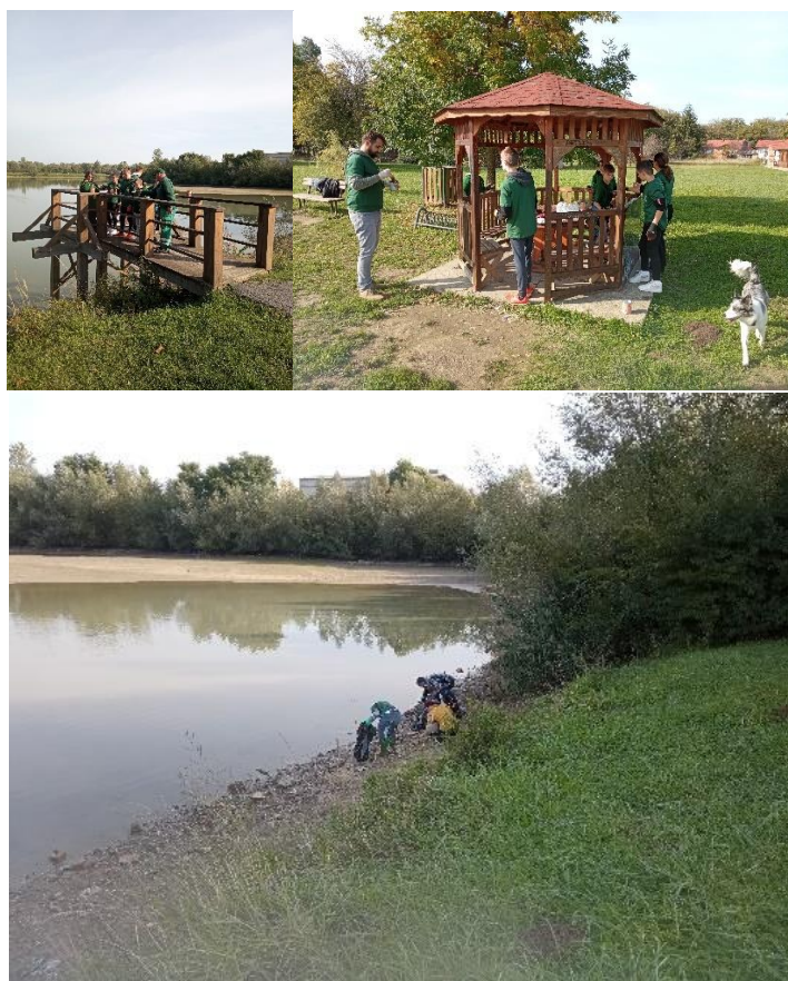
Slika 3. Zelena čistka na području Grada Siska

Grad Sisak je prepoznao važnost kampanje Zelena čistka kao važan korak u promjeni odnosa građana prema primarnom odvajanju otpada i saniranju postojećih lokacija odbačenog otpada. Podupiranjem kampanje omogućuje se aktivno uključivanje građana u rješavanje problema vezanog uz očuvanje okoliša i prirode te se isto tako stvara dodatan iskorak koji pridonosi kvalitetnijem dijalogu s građanima. Dana 24. rujna 2022. godine u Sisku je provedena ekološka akcija Zelena čistka , a lokacija čišćenja je bila Ciglarska graba.