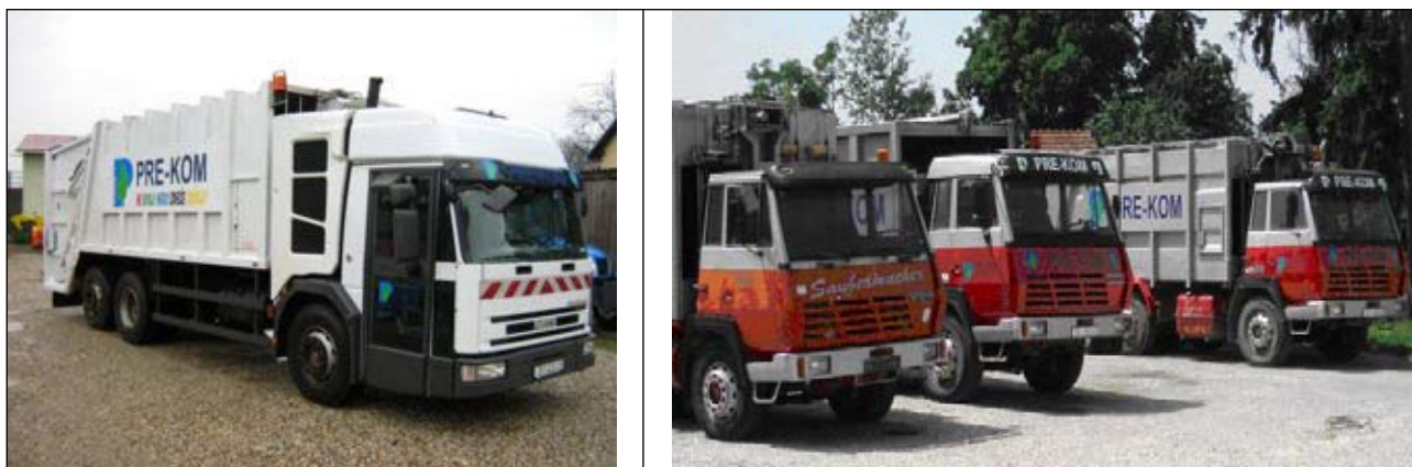
Slika 6 – Kamion za sakupljanje smeća

GKP PRE-KOM d.o.o. odlaže/zbrinjava otpad sa područja Općine Sveta Marije na sljedeći način: