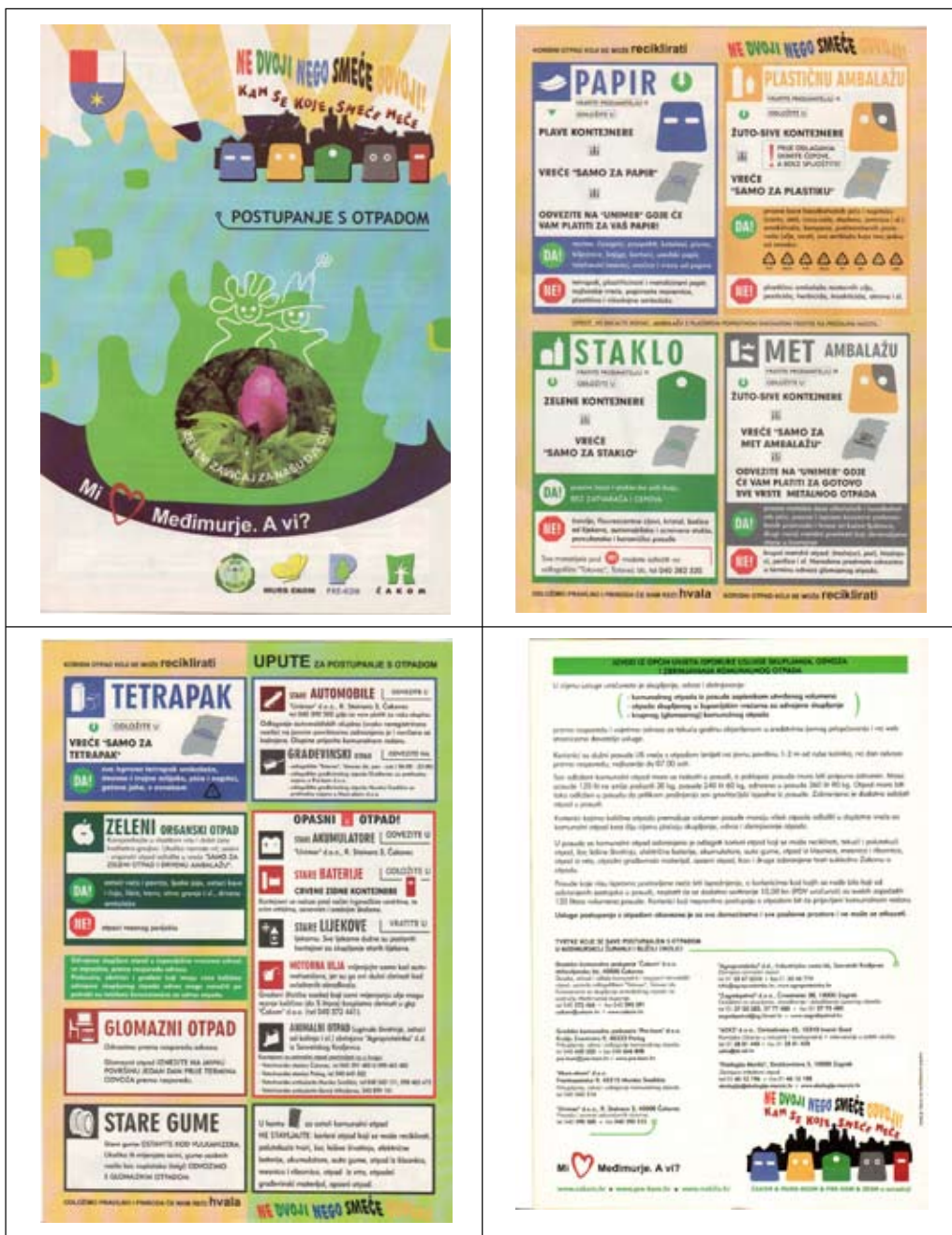
Slika 16 - Županijski edukativni letak

Informiranjem naših korisnika putem medija, letaka i web stranica PRE-KOM-a, nastojimo korisnike dodatno potaknuti na uključivanje u organizirano sakupljanje otpada, a time i odvojeno sakupljanje korisnog otpada.