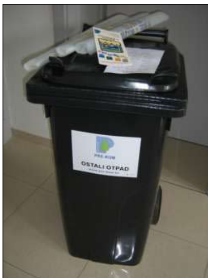
Slika 2 - Kanta za otpad 120 l, vreće za selektivno sakupljanje, edukativni letak

Postupanje sa komunalnim otpadom u Općini Donja Dubrava organizirano je putem GKP PRE-KOM d.o.o..