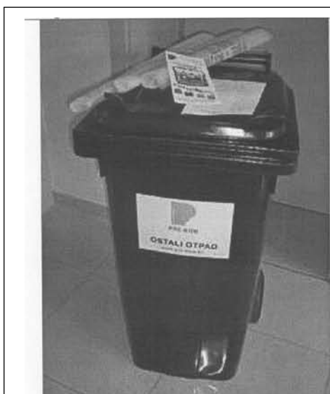
Slika 2 - Kanta za otpad 120 l, vreće za selektivno sakupljanje, edukativni letak

Svako domaćinstvo dobiva kalendar odvoza komunalnog, selektiranog i glomaznog otpada, edukativni letak i besplatne vreće za sakupljanje korisnog otpada.