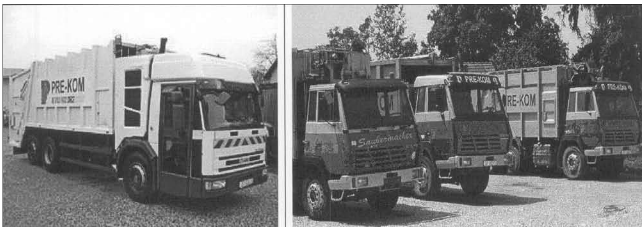
Slika 6 - Kamion za sakupljanje smeća

GKP PRE-KOM d.o.o. odlaže / zbrinjava otpad s područja Općine Goričan na sljedeći način: