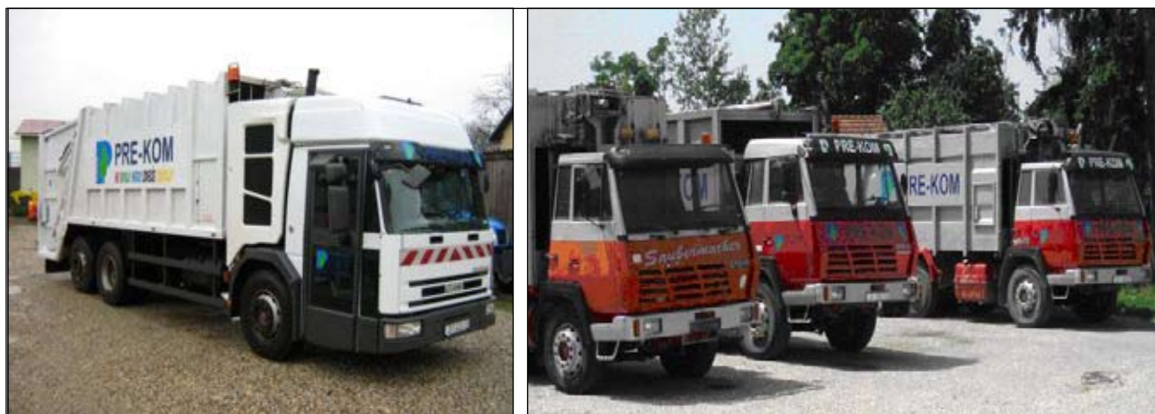
Slika 7 - Kamion za sakupljanje smeća

GKP PRE-KOM d.o.o. odlaže/zbrinjava otpad s područja Općine Kotoriba na sljedeći način: