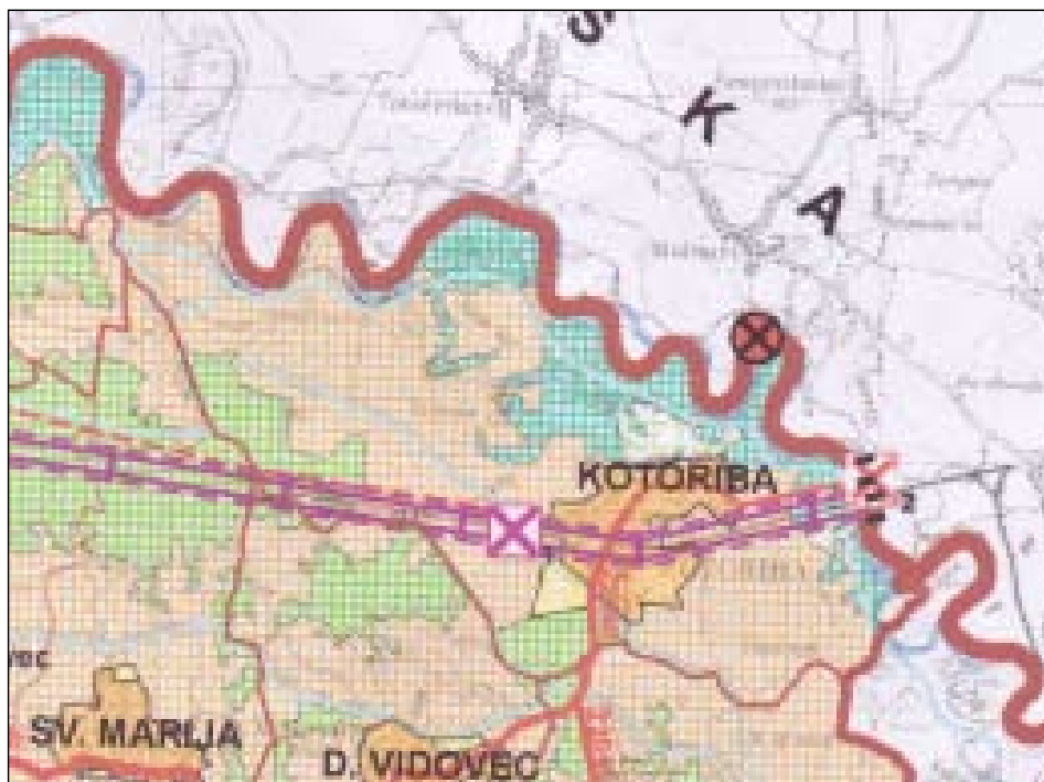
Slika 1 - Općina Kotoriba

kanalizacije. Na području Općine djeluju: osnovna škola, dječji vrtić, poslovica banke, poslovica FINE, matični ured, ispostava policije i carinska ispostava. Na području Općine djeluje veći broj kulturnih i sportskih udruga.