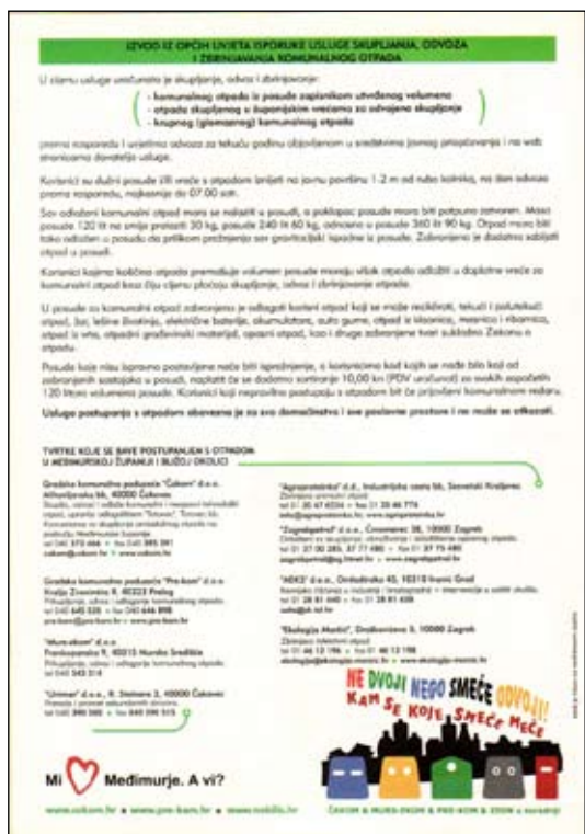
Slika 11 - Županijski edukativni letak