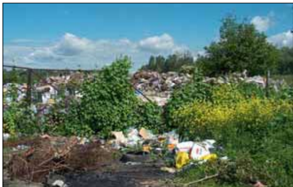
Slika 9 - Matotekovo Vrbje Kotoriba - 2006. godine