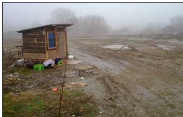
Slika 10 - Matotekovo Vrbje Kotoriba - 2009. godine