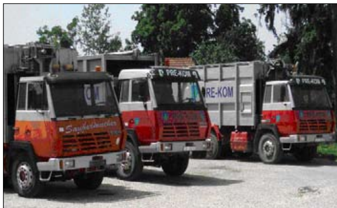
Slika 6 - Kamion za sakupljanje smeća

GKP PRE-KOM d.o.o. odlaže/zbrinjava otpad s područja Grada Preloga na sljedeći način: