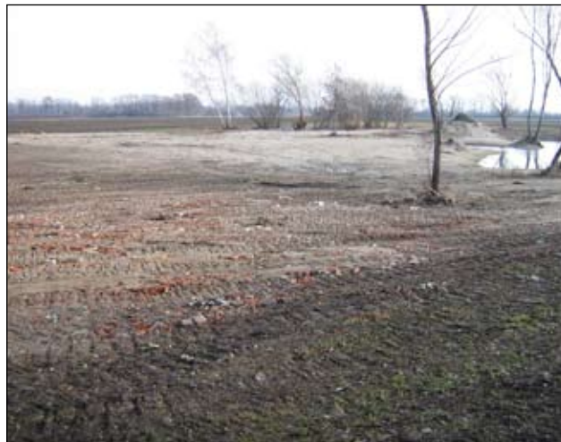
Slika 9 - Čukovec - sada

Smetlište zatvoreno 2007., sanacija u tijeku dovozom građevinskog otpada, te predstoji dovoz humusa i hortikulturno uređenje.