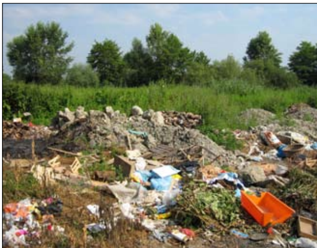
Slika 10 - Hemuševac - prije

Smetlište zatvoreno - dovezena zemlja i planirano