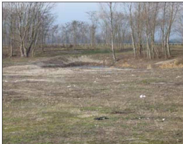
Slika 11 - Hemuševac - sada

Smetlište zatvoreno i djelomično sanirano u 2007. godini, a za 2008. godini potrebno je završiti sanaciju dovozom miješanog materijala, izvršiti sadnju autohtonog drveća, te hortikulturno urediti.