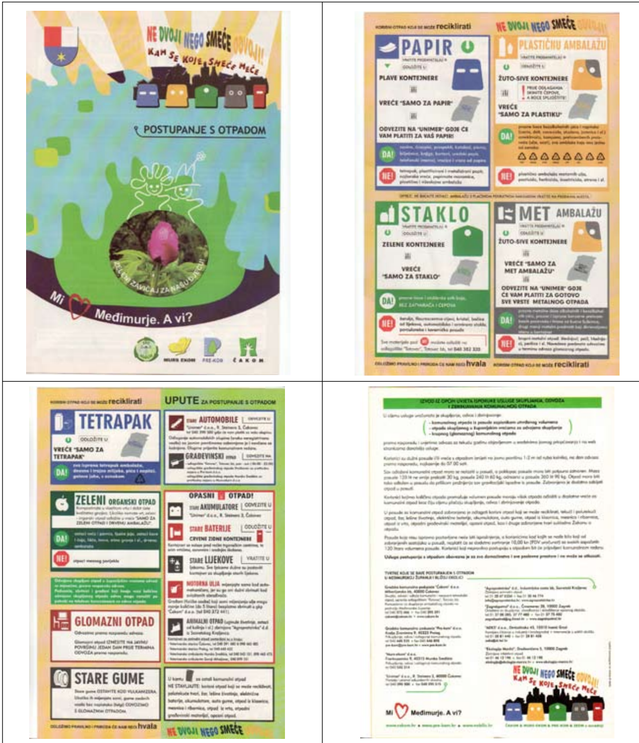
Slika 16 - Županijski edukativni letak

Informiranjem naših korisnika putem medija, letaka i web stranica PRE-KOM-a, nastojimo korisnike dodatno potaknuti na uključenje u organizirano sakupljanje otpada a time i odvojeno sakupljanje korisnog otpada.