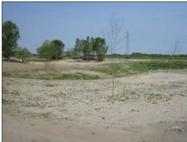
Slika 15 - Cirkovljan - sada