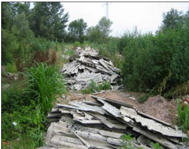
Slika 8 - Čukovec - prije