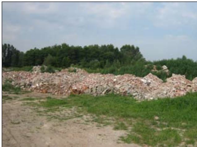
Slika 12 - Draškovec - prije

Bivša šljunčara, otpad se odlaže od 1970. godine. Smetlište je koristilo 676 žitelja Draškovca i 425 žitelja Oporovca.