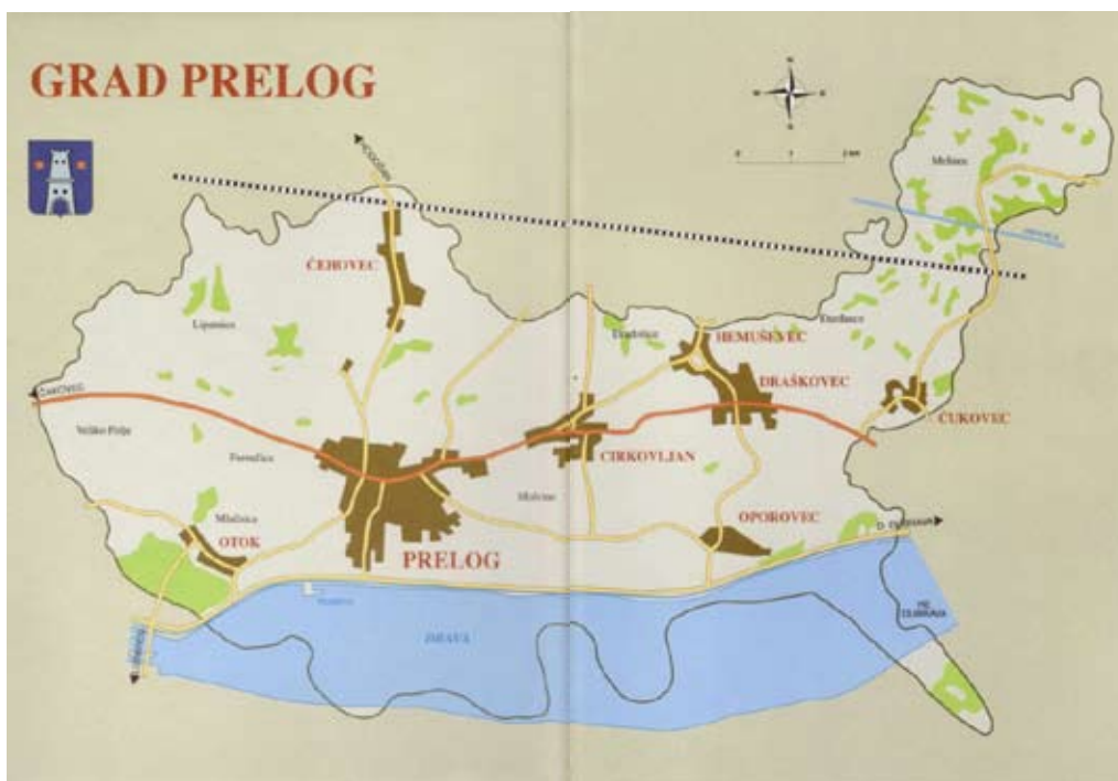
Slika 1 - Plan Grada Preloga

Prelog, grad uz rijeku Dravu, po veličini je druga jedinica lokalne samouprave u najsjevernijoj hrvatskoj županiji. Na oko 6.370 hektara površine, smješten je u donjem dijelu Međimurske županije, istočno od autoceste Goričan - Zagreb. Uza sam Prelog, Grad pokriva i naselja Otok, Čehovec, Cirkovljan, Draškovec, Hemuševac, Oporovec i Čukovec s ukupno oko 7.870 stanovnika.