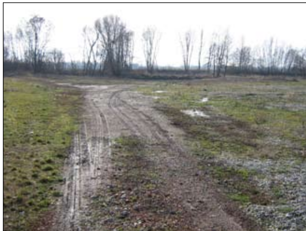
Slika 13 - Draškovec - sada

U 2008. godini potrebno je izvršiti kompletnu sanaciju i to sadnjom autohtonog bilja, te zasijavanjem trave.