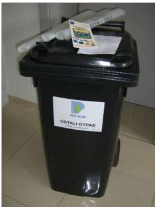
Slika 2 - Kanta za otpad 120 l, vreće za selektivno sakupljanje, edukativni letak