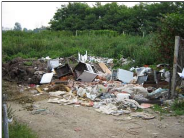
Slika 14 - Cirkovljan - prije