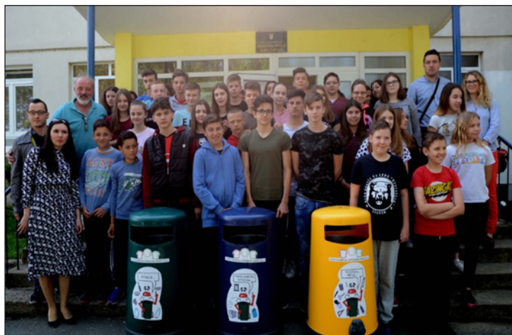
Slika 12. Nagrada (spremnici za odvojeno sakupljanje otpada) OŠ Galdovo na najvećoj količini sakupljenog papira

Četiri osnovne škole koje su imale najviše sakupljenog papira i kartona dobile su na raspolaganje po jedan »zeleni otok« (set od tri spremnika za korisni otpad) koji mogu biti smješteni u prostoru škole ili pretprostoru škole. Ovom prilikom čestitamo OŠ Braće Bobetko, OŠ Braća Ribar, OŠ 22. lipnja i posebno OŠ Galdovo koja je imala najveću količinu sakupljenog papira na osvojenim spremnicima.