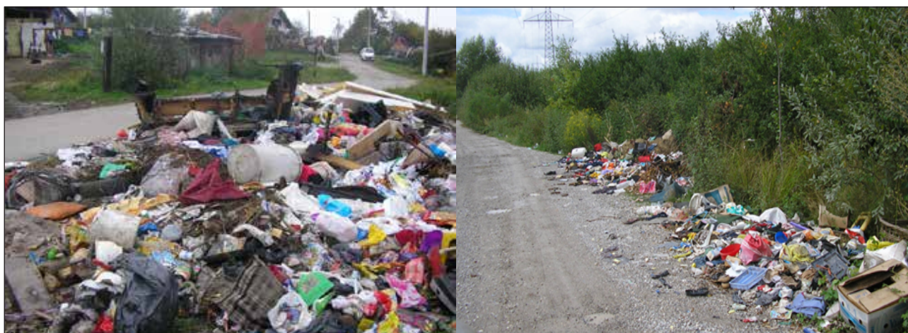
Slika 5. Odbačeni otpad na lokaciji Capraške poljane

Uklanjanje odbačenog otpada je tijekom 2018. godine provedeno u skladu s prijavama komunalnih redara i građana te kroz redovan odvoz miješanog komunalnog otpada, ukoliko su lokacije odbačenog otpada bile pozicionirane uz same posude za sakupljanje miješanog komunalnog otpada te je sastav otpada bio takav da ga se moglo odvesti u redovnoj liniji sakupljanja otpada.