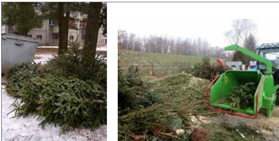
Slika 9. Odbačene drvene sječke i izrezivanje u drobilici za proizvodnju sječke