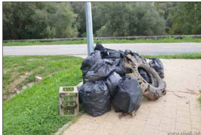
Slika 7. Zelena čistka na području Starog grada

U sklopu iste akcije održana je i Plava čistka na Jadranskom moru. Pod pokroviteljstvom Grada Siska, Športsko rekreacijskog centra Sisak i Općine Gradac, Ronilački klub Sisak je organizirao akciju »Eko Sisak u Zaostrogu«. Tijekom ove akcije 30-ak ronioaca je sudjelovalo u čišćenju podmorja dijela akvatorija ispred Odmarališta Zaostrog.