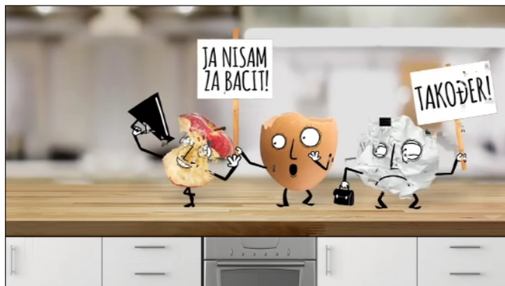
Slika 10. Edukativni video Fonda za zaštitu okoliša i energetske učinkovitost vezan za razvrstavanje otpada

Na web stranici GOS-a objavljen je edukativni video vezan za razvrstavanje korisnog otpada.