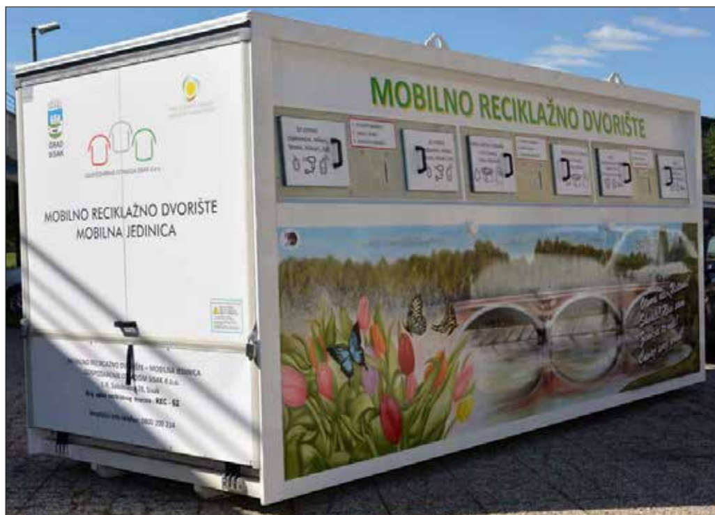
Slika 2. Mobilno reciklažno dvorište