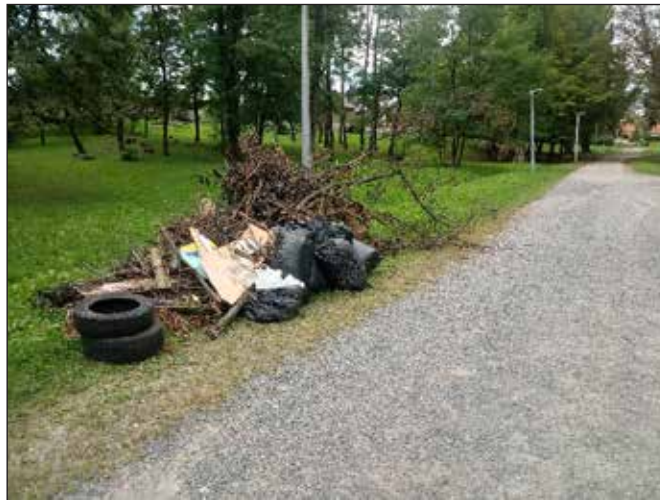
Slika 6. Zelena čistka na području park šume Viktorovac