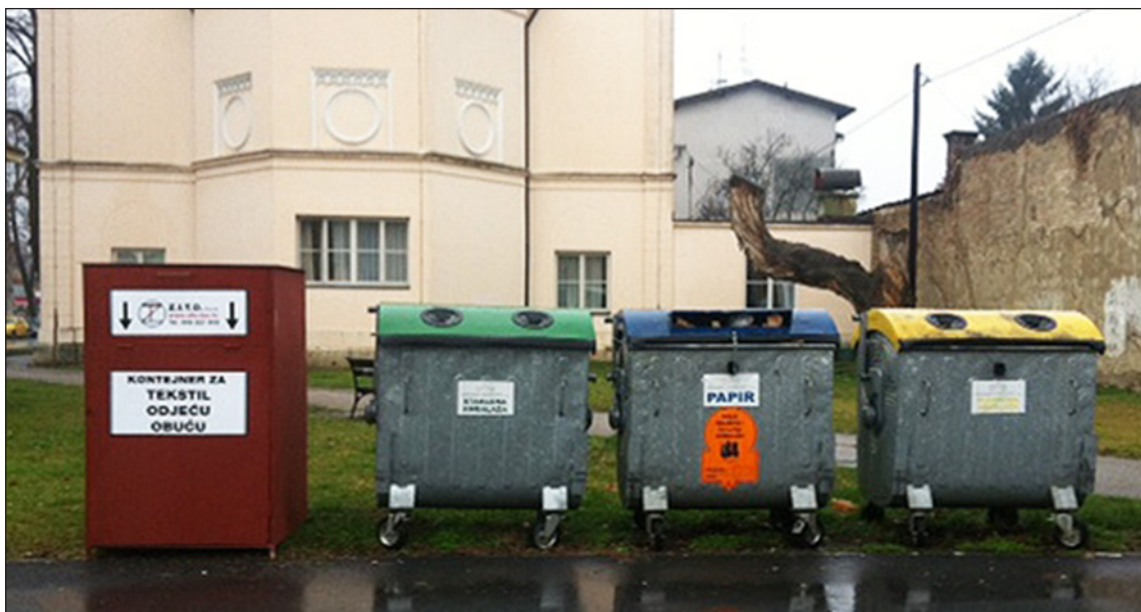
Slika 3. »Zeleni otok«

Lokacije »zelenih otoka« moguće je pronaći na internet stranici tvrtke GOS kako je prikazano na sljedećoj slici.