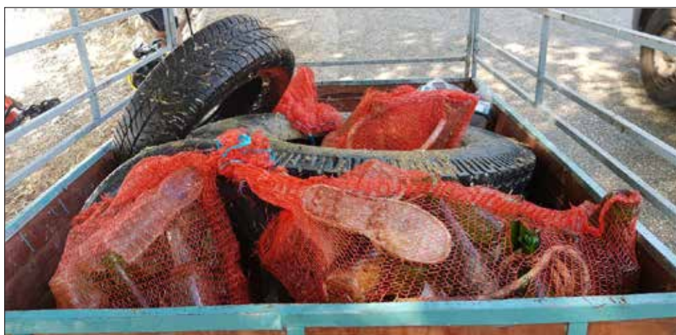
Slika 8. Plava čistka akvatorija ispred Odmarališta Zaostrog

U sklopu iste akcije održana je i Plava čistka na Jadranskom moru. Pod pokroviteljstvom Grada Siska, Športsko rekreacijskog centra Sisak i Općine Gradac, Ronilački klub Sisak je organizirao akciju »Eko Sisak u Zaostrogu«. Tijekom ove akcije 30-ak ronioaca je sudjelovalo u čišćenju podmorja dijela akvatorija ispred Odmarališta Zaostrog.