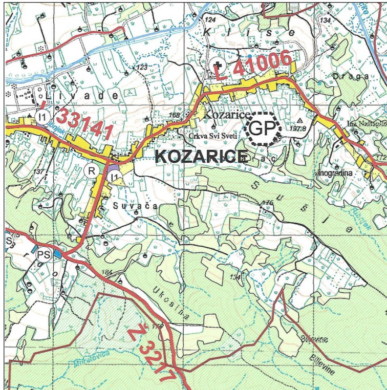
Slika 1. Kartografski prikaz- Korištenje i namjena površina iz PPUG Novska