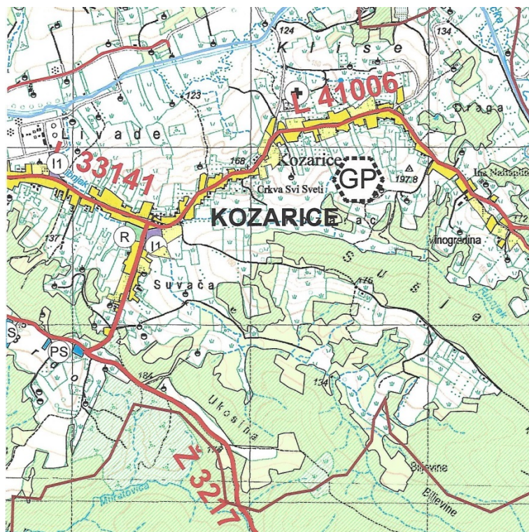
Slika 1. Kartografski prikaz- Korištenje i namjena površina iz PPUG Novska

Unutar obuhvata Plana, u naselju Kozarice, predviđena je lokacija u ispitivanju za odlagalište građevinskog otpada, a njena pozicija prikazana je na grafičkom prilogu 2. Korištenje i namjena površina (GP).