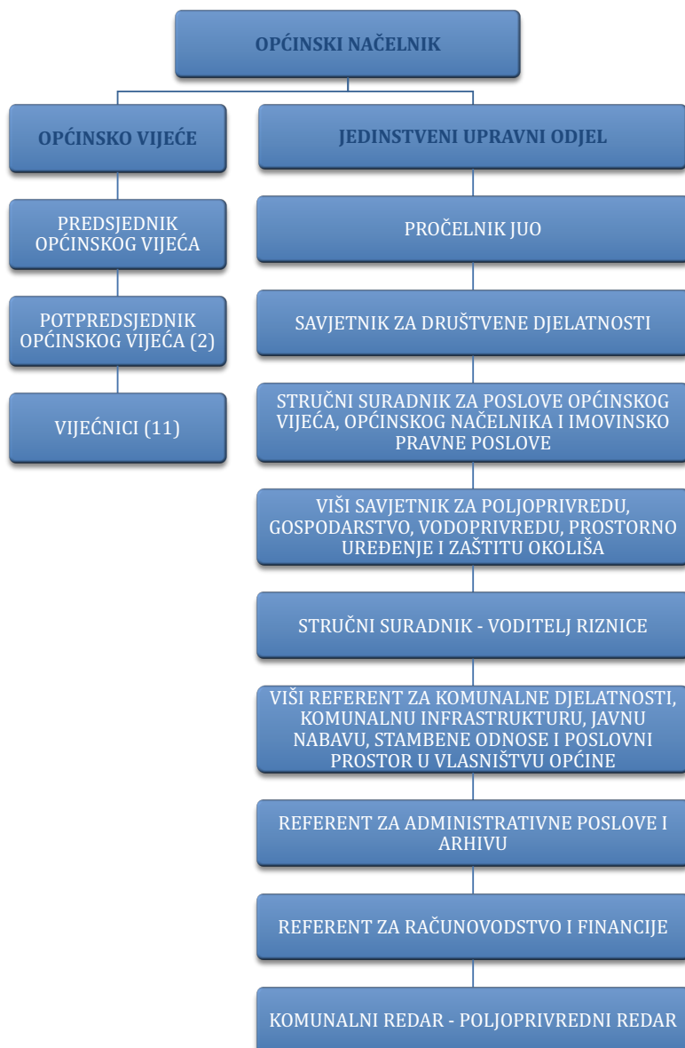
Slika 1. Organizacijska struktura Općine Sunja