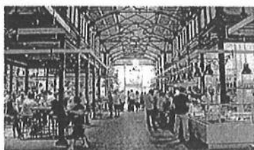
Restoran na tržnici