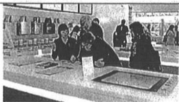
Centar za posjetitelje s Apple opremom