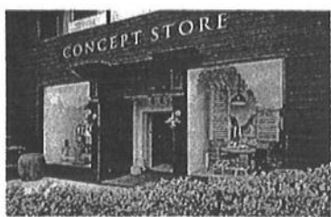
'Product design' dućan