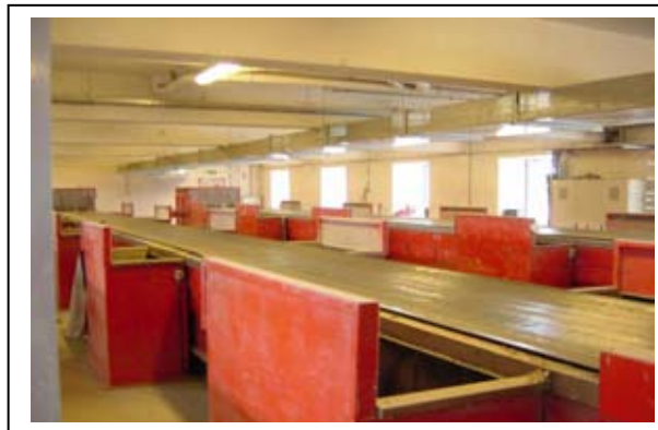
Slika 6.6-12. Unutrašnjost kabine za ručno sortiranje

Plastični materijali, dobiveni iz postrojenja za sortiranje, separirani su po tipu, pa se kao takvi mogu izravno primijeniti u postrojenjima za oporabu (reciklažu). Najveći dio tih materijala se bez poteškoća može plasirati na zapadnoeuropsko tržište kao sirovina u postrojenjima za recikliranje plastičnih materijala.