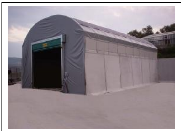
Slika 6.6-7. Tunel (fermentator)