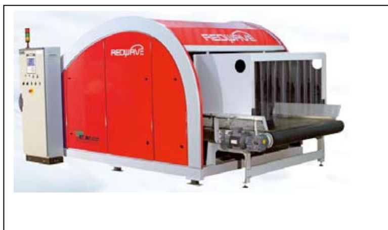
Slika 6.6-6. NIR separator

Frakcija komunalnog otpada dimenzija većih od 150 mm sastoji se uglavnom od papira, kartona, većih polietilenskih folija i tekstila. Ona se direktno upućuje na ručno sortiranje, jer je materijal takvih dimenzija vrlo jednostavno separirati i pripremiti za materijalnu obradu.