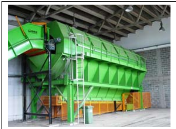
Slika 6.6-4. Rotacijsko sito

Frakcija komunalnog otpada dimenzija 80-150 mm sastoji se uglavnom od plastike, papira, tekstila i ostalog. Ova se frakcija prije ručnog sortiranja upućuje