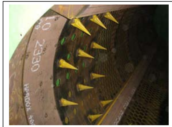
Slika 6.6-5. Noževi za otvaranje vrećica