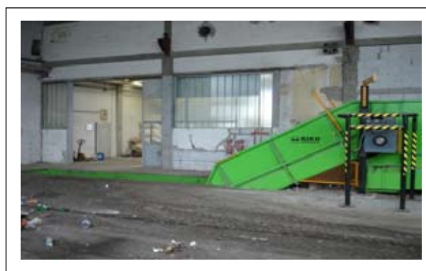
Slika 6.6-3. Usipni koš u ulazni transporter

U brzo okretajućem rotacijskom situ (Slika 6.6-4) ugrađeni su specijalni noževi kojima se vrši otvaranje vreća i vrećica sa skupljenim otpadom te automatska separacija otpada prema veličini (Slika 6.6-5). Tako