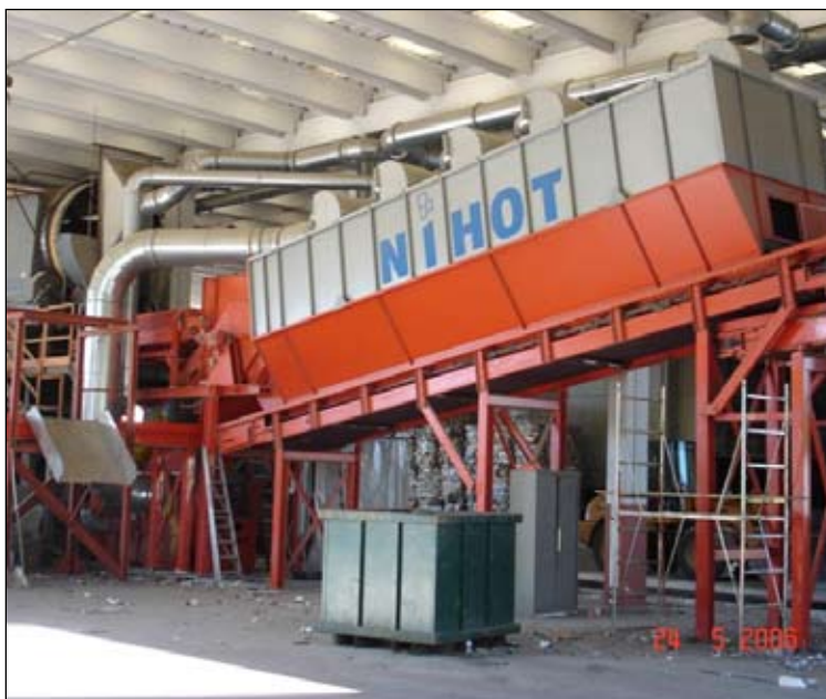
Slika 6.6-13. Zračni separator

Iz preostalog se otpada zračnim separatorom (Slika 6.6-13.) odvaja lagana frakcija ( gorivi dio ), koja se odmah nakon odvajanja može usitniti na veličinu pogodnu za primjenu u industrijskim pećima. Gorivi dio obrađenog otpada moguće je i balirati. Jednom separiran, na opisani način imbalirani i folijom omotani gorivi dio otpada može se i dugoročno uskladištiti bilo na otvorenom ili u zatvorenom prostoru. Naime, on je u potpunosti higijeniziran, te ne postoji mogućnost samozapaljenja (nema biorazgradive komponente). Ukoliko je balirano ili adekvatno zaštićeno, kruto oporabljeno gorivo može se skladištiti i na otvorenom prostoru.