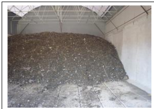
Slika 6.6-8. Unutrašnjost tunela

Dobivena biorazgradiva frakcija (»biostabilat«) nakon opisano procesa je stabilizirana i higijenzirana te se može upotrijebiti kao dnevna pokrivka sanitarnog odlagališta otpada ili se može koristiti kao dopunski materijal pri sanaciji odlagališta otpada.