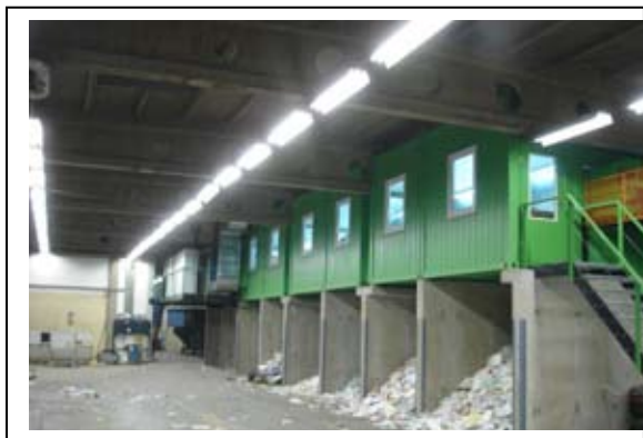
Slika 6.6-11. Kabina za sortiranje s "boksovima" u kojima se nalazi separirani materijal