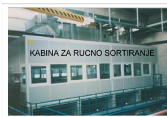
Slika 6.6-10. Kabina za ručno sortiranje (izvana)