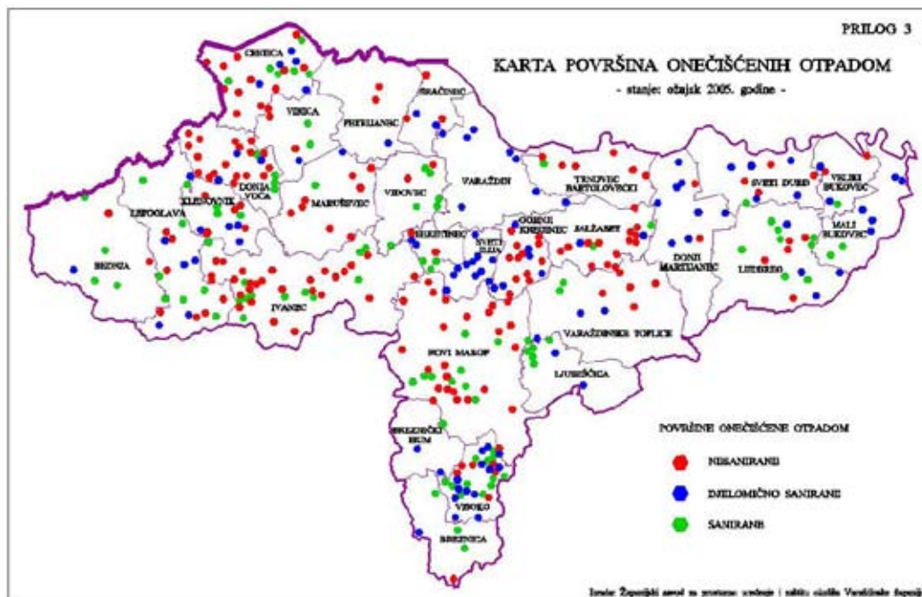
Slika 1. Površine onečišćene otpadom na području Varaždinske županije 5

Prema podacima Grada Varaždina, dostupnih u Programu zaštite okoliša u 2007. g. s projekcijom za 2008. i 2009. g. te Programu zaštite okoliša u 2008. g. s projekcijom za 2009. i 2010. g., a koji se odnose na »divlja« odlagališta otpada, tj. njihovo uklanjanje i sanaciju njihovih lokacija (članak 3., točka A. »Osnovne aktivnosti komunalnog redarstva«, podtočka 4.), sanacija »divljih« odlagališta se provodi prema stvarnim potrebama na terenu i u kontaktu s predstavnicima mjesnih odbora. U 2008. g. bila je planirana sanacija »divljih« odlagališta nastalih uz lijevu i desnu obalu Dravskog kanala.