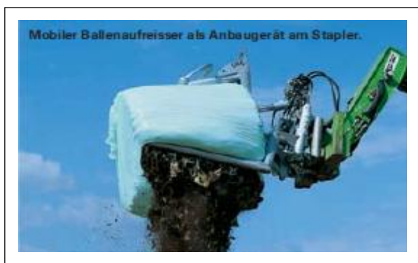
Slika 6.6-2. Otvaranje bala komunalnog otpada