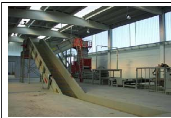
Slika 6.6-9. Preša za imbaliranje

Papir i karton su otpadni materijali čija se uporaba provodi već dugi niz godina u cijelom svijetu, pa tako i u Hrvatskoj. Važno je napomenuti da tvornice papira u Hrvatskoj uvoze velike količine papira i kartona iz zapadnoeuropskih zemalja. Stoga plasman selektivnog papira i kartona u našoj zemlji neće predstavljati nikakvu poteškoću.