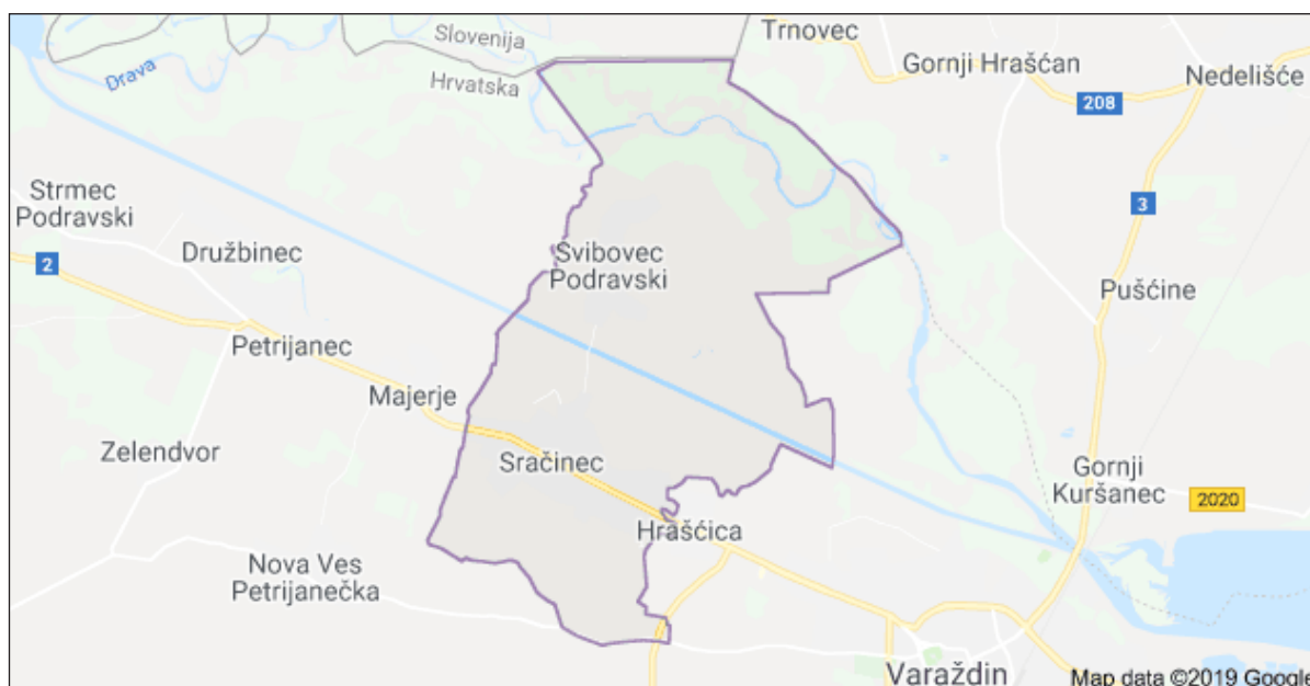
Slika 1: Područje Općine Sračinec s naseljima

Općina Sračinec nalazi se u nizini na sjeverozapadu Varaždinske županije (Slika 1). Sjevernim dijelom Općine protječe rijeka Drava gdje Općina i graniči s Republikom Slovenijom i Međimurskom županijom. Općina Sračinec prostire se na površini od 23,41 km 2 i sastoji se od dvije katastarske općine, cijele k.o. Sračinec i dijela k.o. Varaždin. Na području općine smještena su dva naselja, Sračinec i Svibovec Podravski. Iako je Općina Sračinec površinski jedna od najmanjih u Županiji istovremeno je i jedna od najgušće naseljenih.