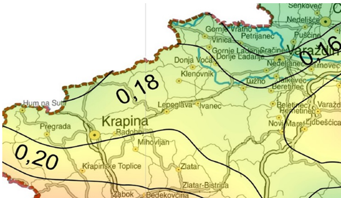
Slika 3. Karta potresnih područja RH, za povratno razdoblje 475 godina