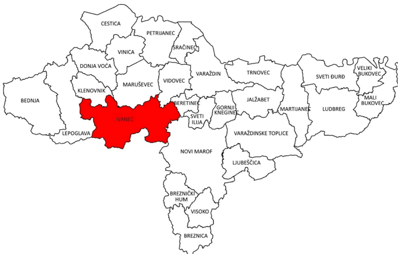
Slika 1. Položaj Grada Ivanca u Varaždinskoj županiji

Grad Ivanec smješten je u sjeverozapadnom dijelu Republike Hrvatske unutar Varaždinske županije. Na sjeveru graniči s općinama Klenovnik, Maruševac, Vidovec i Beretinec, na zapadu s Gradom Lepoglavom, na istoku s Gradom Novim Marofom, dok južnu granicu područja čini granica s Krapinsko-zagorskom županijom.