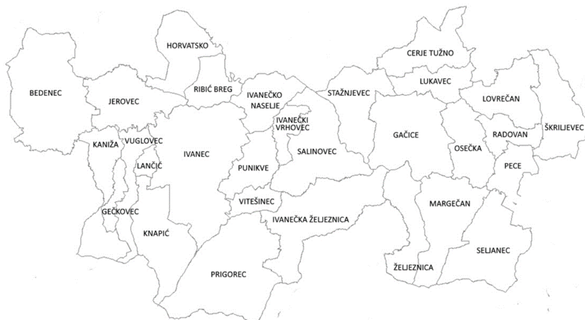
Slika 2. Raspored naselja na području Grada Ivanca