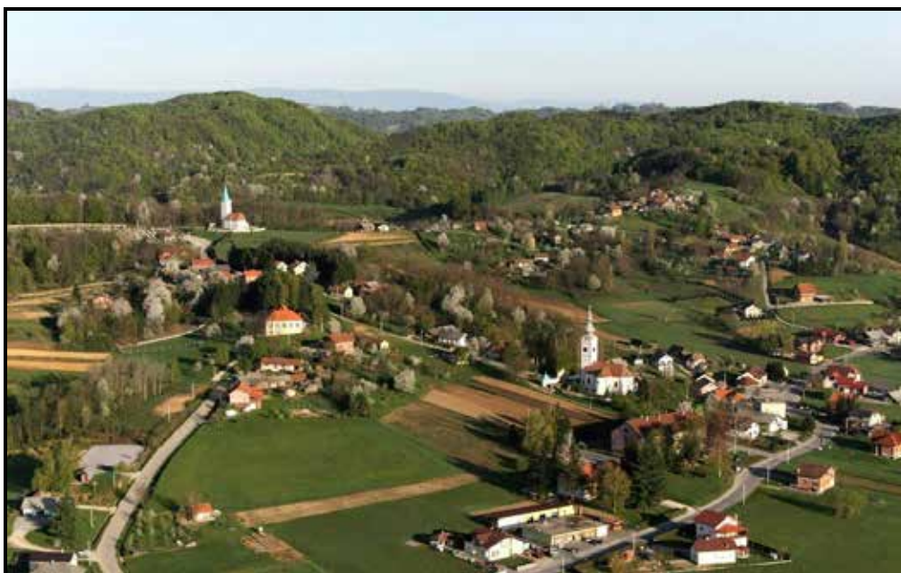
Donja Voća, ožujak 2018.