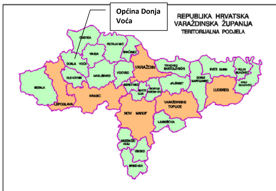
Slika 1: Položaj Općine Donja Voća u Varaždinskoj županiji

Prema broju stanovnika najmnogobrojnije naselje u Općini je Donja Voća, a zatim slijede: Gornja Voća, Rijeka Voćanska, Slivarsko, Budinščak, Jelovec Voćanski, Plitvica Voćanska, te Fotez Breg. Prosječna veličina naselja u Županiji je 630 stanovnika po naselju, dok je taj prosjek u Općini Donja Voća 307 stanovnika po naselju (Popis 2011. godine), što je uvjetovano općim demografskim stanjem Općine. Gustoća naseljenosti na području Općine je 68,2 stanovnika/km 2 , što je ispod gustoće naseljenosti Županije.