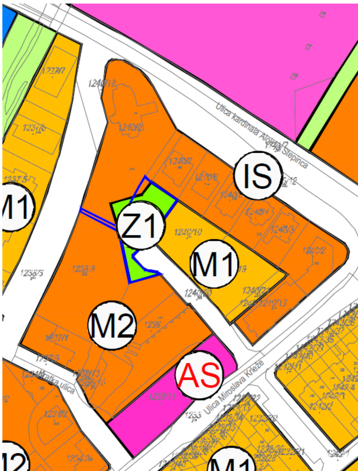
Prilog 3. : Prikaz ispravka tehničke greške (označeno plavom linijom) na isječku kartografskog prikaza 1. Korištenje i namjena površina VI. izmjena i dopuna Urbanističkog plana uređenja Ludbreg (»Službeni vjesnik Varaždinske županije«, broj 49/22)