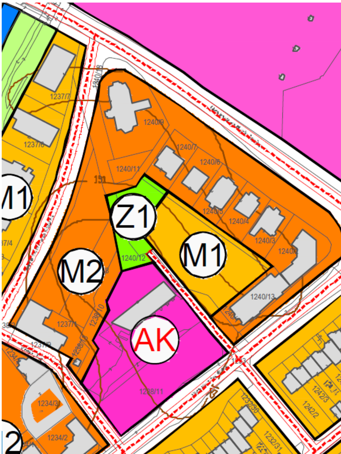
Prilog 2. : Izvod iz Ciljanih izmjena i dopuna Urbanističkog plana uređenja Ludbreg »Službeni vjesnik Varaždinske županije«, broj 21/15