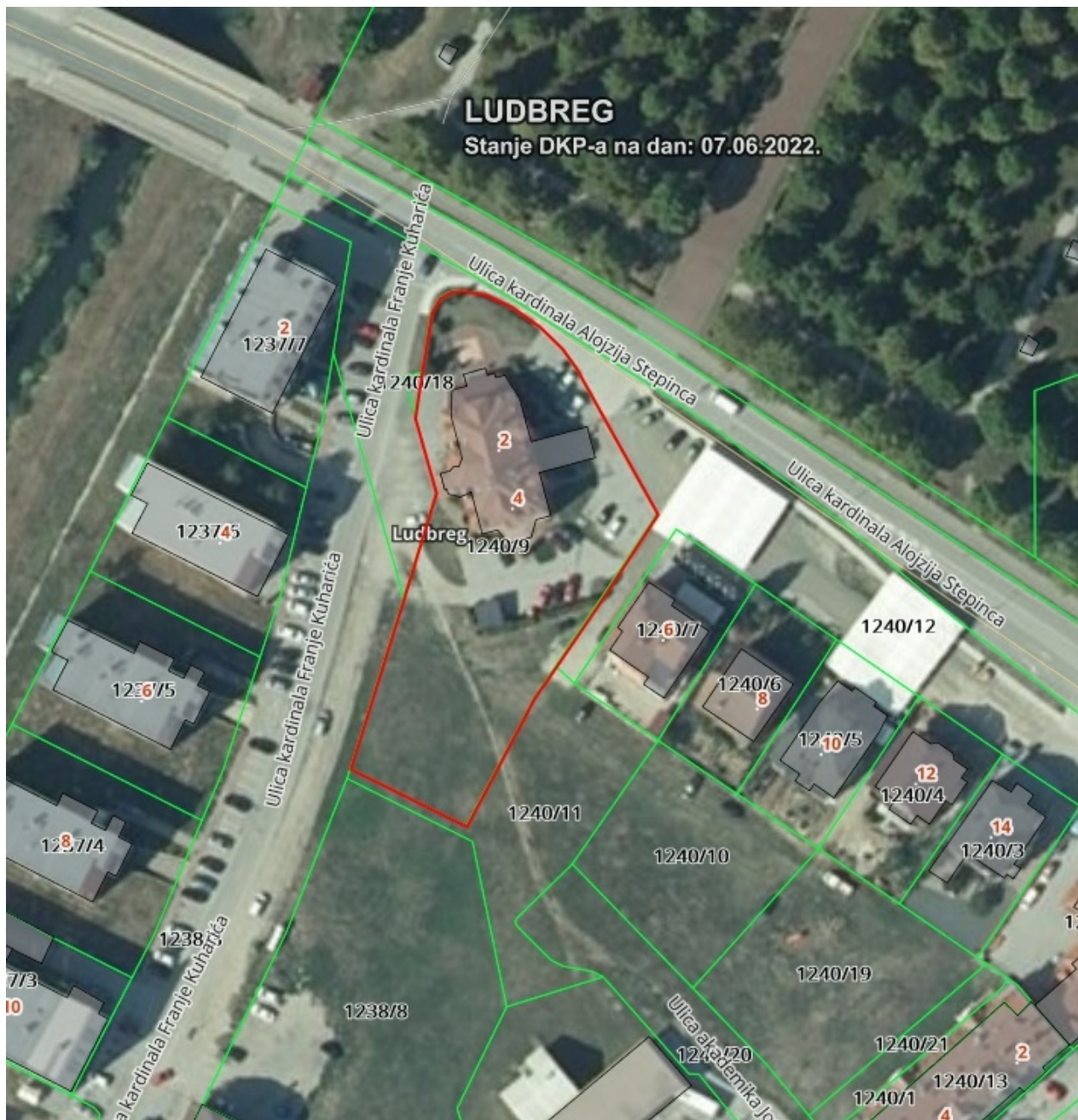
Prilog 5. : Izvod iz DGU Geoportala - https://geoportal.dgu.hr/ sa označenom predmetnom česticom (crvenom linijom)