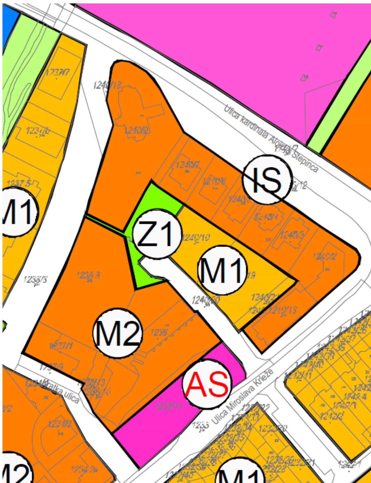
Prilog 4. : Konačni prikaz ispravke tehničke greške kako će biti prikazano na kartografskom prikazu 1. Korištenje i namjena površina u pročišćenom tekstu Urbanističkog plana uređenja Ludbreg